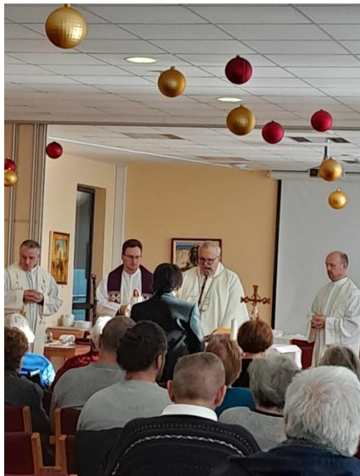
ŠKOFOVA SVETA MAŠA