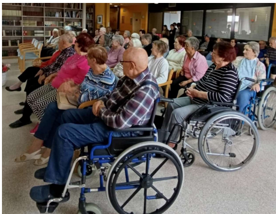
13. 5. 2025 – SAJENJE BALKONSKIH ROŽ