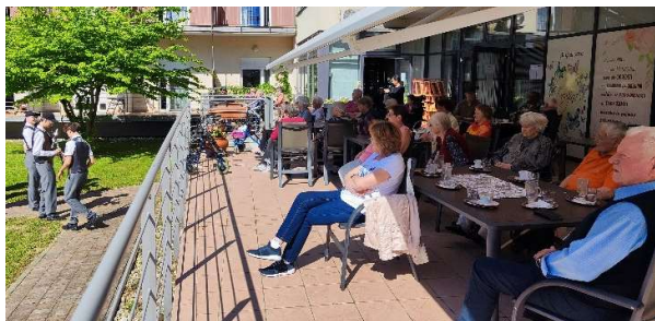
7. 5. 2025 – OBISK OŠ KAPELA