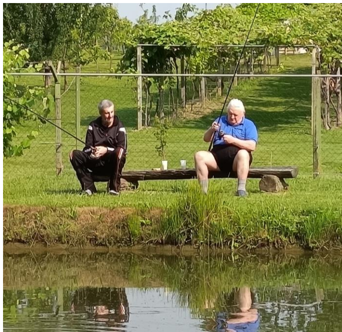
12. 6. 2025 RIBOLOV