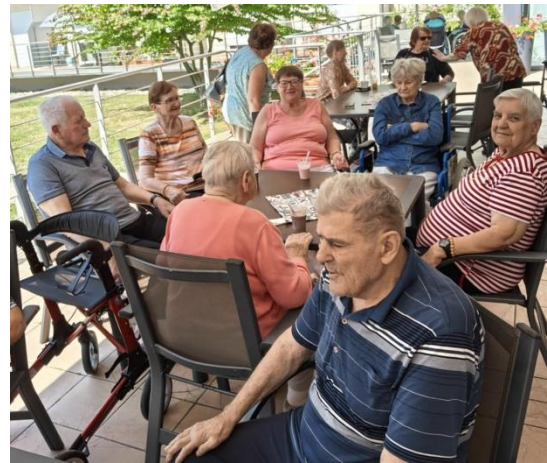
20. 6. 2025 OBISK MAČJEGA MESTA