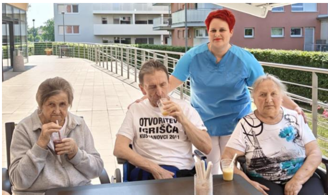
13. 6. 2025 SMUTIJI