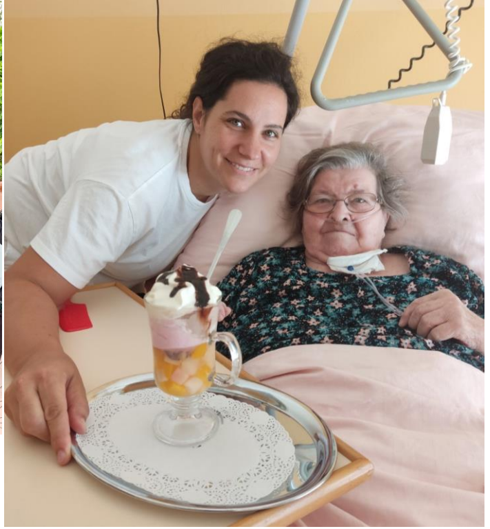
25. 7. 2025 LÜŠTI NA TERASI - SLADOLED