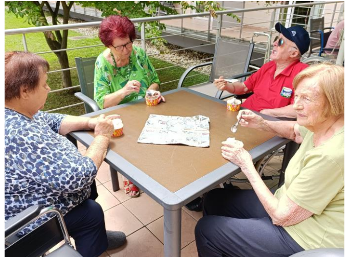
17. 7. 2025 – SLADOLED