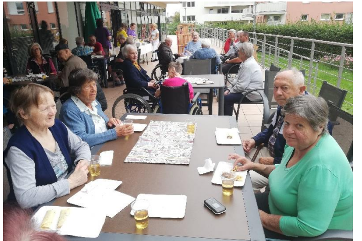
23. 9. 2025 PALAČINKE