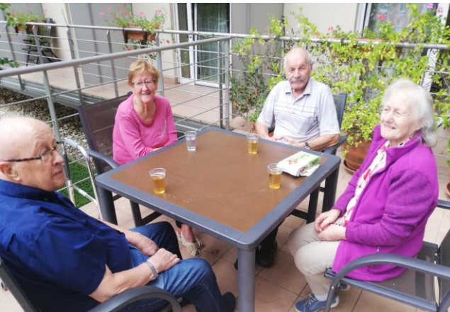
29. 9. 2025 LIČKANJE KORUZE