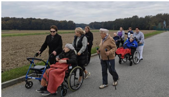
17.10.2025 PIKNIK Z MALIMI KOSTANJČKI