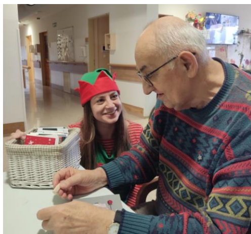
19.12.2025 ŠKOFOVA MAŠA