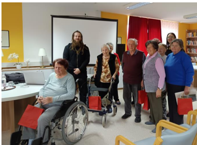
24.12.2025 BOŽIČEK V HIŠI