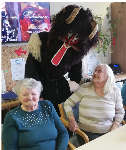
17. 2. 2026 PUSTNO RAJANJE