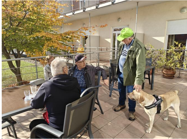
11. 11. 2025 NASTOP LOTMERŠKIH TAMBURAŠOV IN KRST MOŠTA