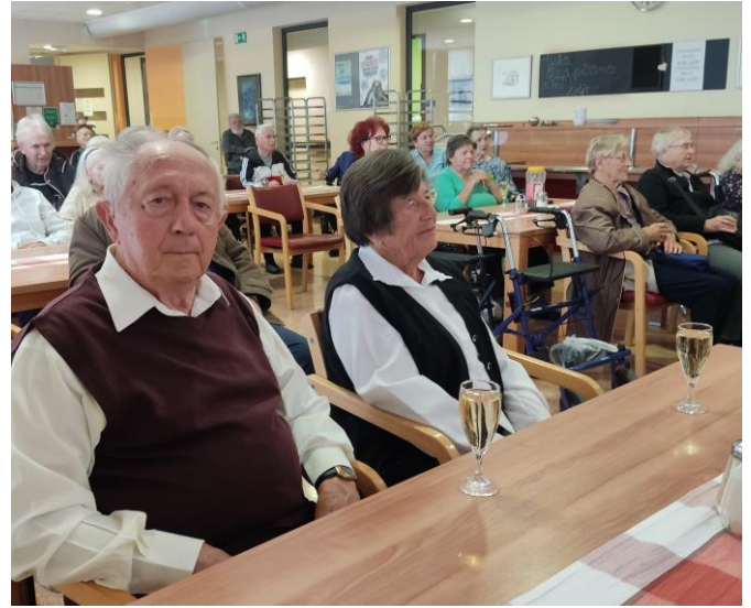
19. 11. 2025 KTD SELCE